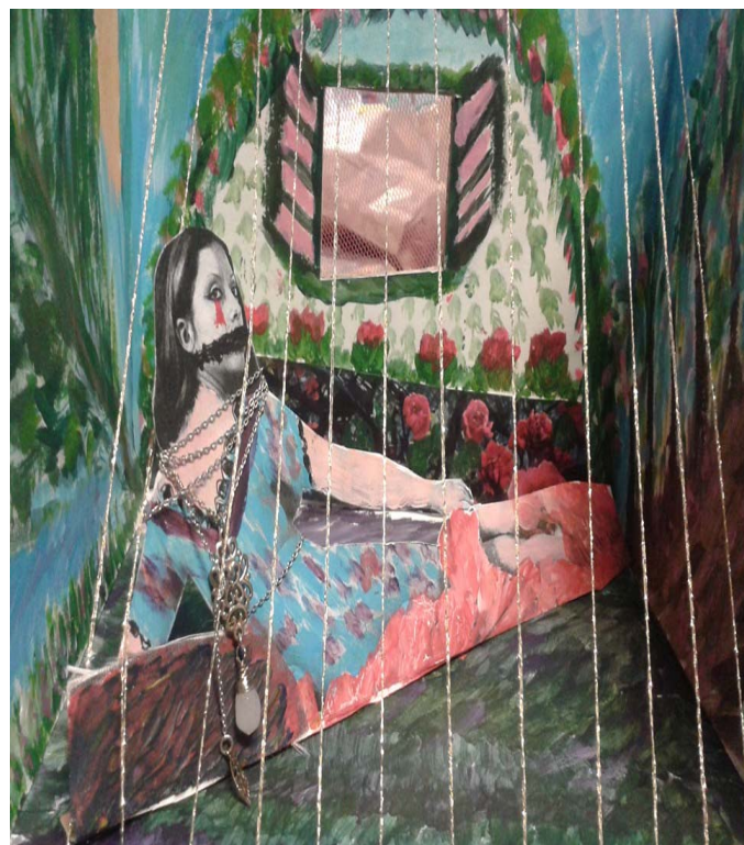
Collectif Pélagie exposition des réalisations des femmes

L'Escale Solidarité Femmes 6 allée Frantz Fanon 92230 Gennevilliers Tel. 01 47 33 09 53 – Fax 01 47 33 09 73 – E.mail : skle@wabadoo.fr